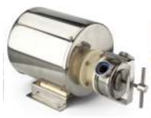
Pompa z silnikiem w osłonie