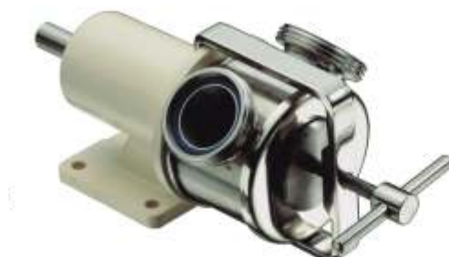
Pompa z wolnym wałem do połączenia z napędem na wspólnej podstawie Pompa w wersji przenośnej, 230V z wyłącznikiem Pompa z