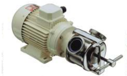
Pompa połączona z napędem

Wirniki sanitarne posiadają certyfikat zgodności ze standardami FDA