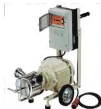
Mobilna pompa na wózku z szafką sterowniczą