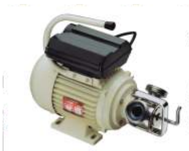
Pompa w wersji przenośnej, 230V z wyłącznikiem